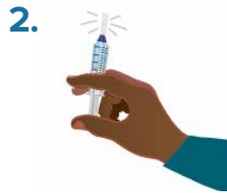
2. Tap or shake syringe for 30 seconds.