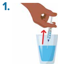
1. In first container, fill up syringe (rig) with clean water.