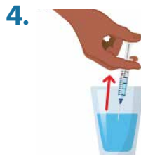
4. In second container, fill up syringe (rig) with bleach.