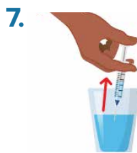
7. In third container, fill up syringe (rig) with new, clean water.