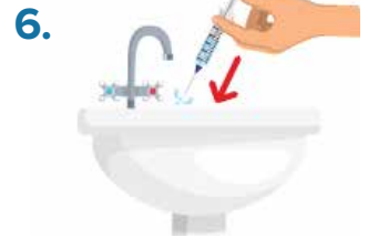
6. Discard bleach from syringe.