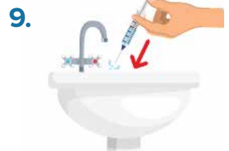
9. Discard water from syringe.

Because viral hepatitis can survive on surfaces (even if you can't see blood), you should clean cookers with water and bleach.