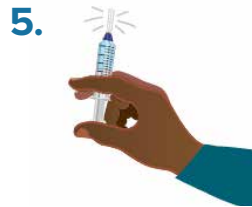
5. Tap or shake syringe for 30 seconds.