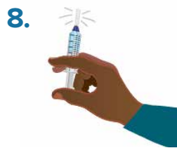
8. Tap or shake syringe for 30 seconds.