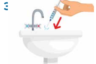
3. Discard water from syringe.

REPEAT steps 1, 2, and 3 at least once or until water in syringe is clear (no blood).